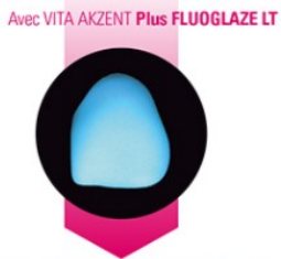
Avec VITA AKZENT Plus FLUOGLAZE LT Agent fluorescent et de glaçage parfaitement harmonisé et homogènement appliqué > VITA AKZENT Plus FLUOGLAZE LT